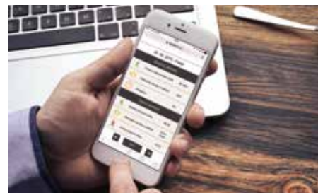
Dokonalý přehled má zaměstnavatel i na cestách připojením do systému přes mobilní telefon.

bychom neplatili statisícové sankce už jen z toho důvodu, že splňujeme požadavky dané státem. Systém má nejen funkci docházky, ale je mnohem komplexnější, protože podporuje rovnoprávnost vzájemných čtyř vzeb Stát – Zaměstnavatel – Zaměstnanec – Zaměstnanec, a to nejen z hlediska zajištění práv a povinností, ale také z hlediska osobní jistoty, spravedlnosti, pracovní pohody a osobní svobody, což umožňuje přesná evidence odpracované doby se všemi typy přestávek. Díky tomuto nastavení vím, že už nebudu muset jako zaměstnavatel platit „jen za pobyt“ na pracovišti nebo za „domnělé“ přesčasy, nýbrž pouze za reálný odpracovaný čas, tedy i skutečné přesčasy, a potom bude každému pracovníkovi náležet spravedlivá odměna. Další zajímavá a užitečná funkce je, že systém může sloužit jako tzv. podnikový „Facebook“. U nás ve společnosti Vege + jej hojně využíváme k efektivní komunikaci a rychlému šíření dobrých zpráv.