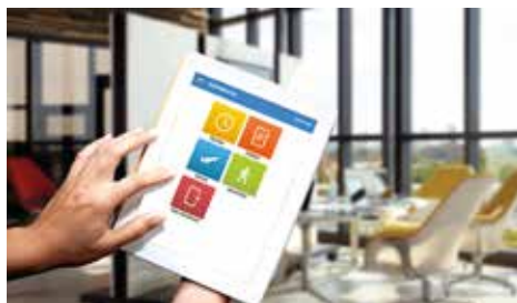
Docházka pomocí tohoto systému se vede prostřednictvím dotykového tabletu s kamerou.

V zásadě se rozdělují na dvě skupiny. Do první skupiny patří klienti, kteří již nějaký systém používají a někteří z nich sdělují, že je pro ně náš systém složitější, protože jeho správa není automatická. Do druhé skupiny bych zařadila ty, kteří zatím žádný systém nepoužívali. Pro tyto klienty umožňujeme poskytnutí licence na 14 dní zdarma. V průběhu této doby byly ohlasy kladné na provoz celého systému, ale zároveň