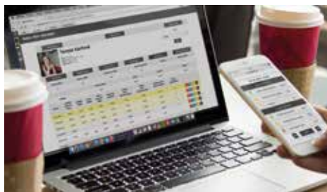
Pro systém APUtech není nutné instalovat žádný software. Vše otevřete jednoduše ve svém internetovém prohlížeči.